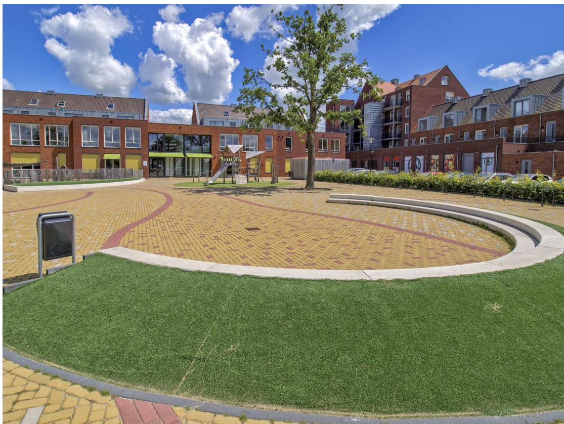
6: Hoe heet het gebouw waar de Knotwilg en Eben Haëzer in zitten?