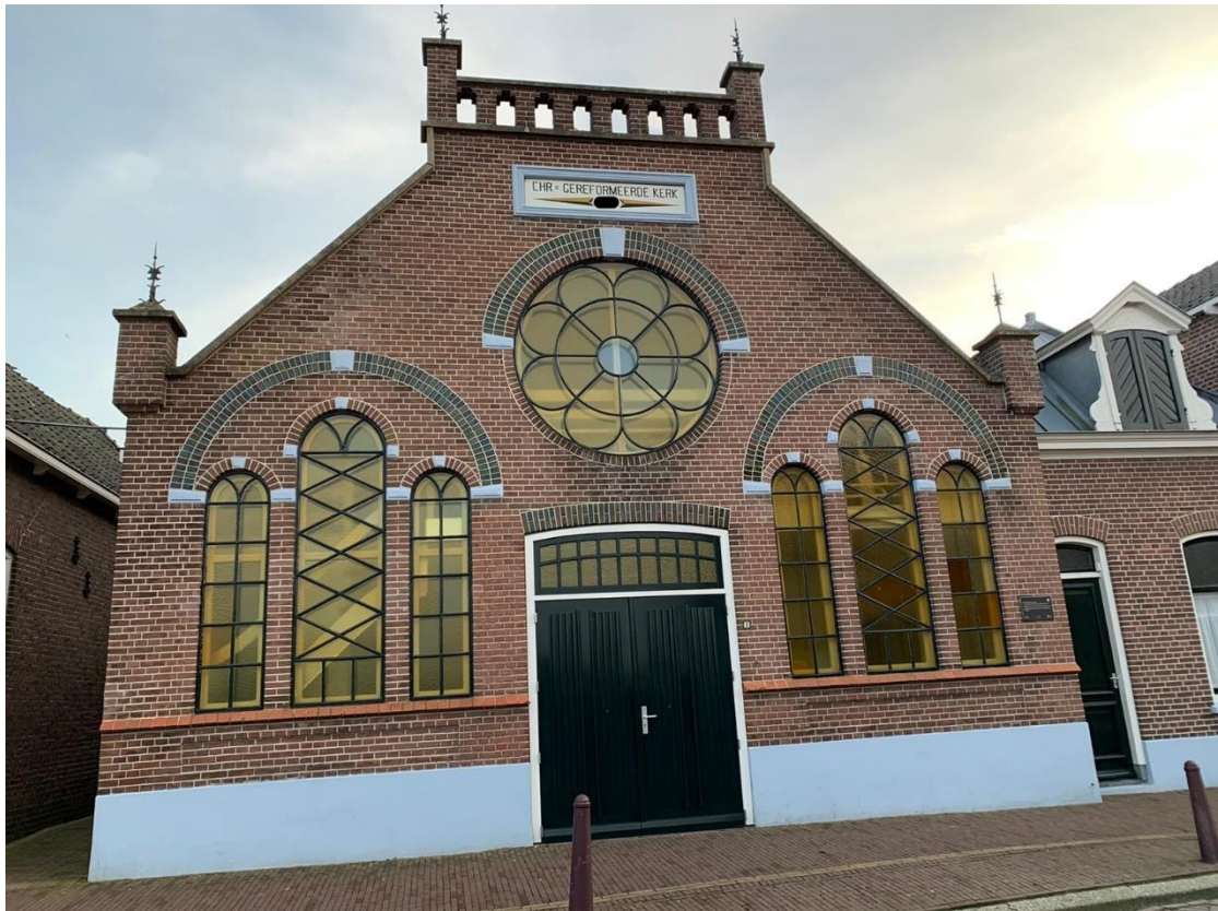
15: Wat voor figuur zie je in het ronde raam?