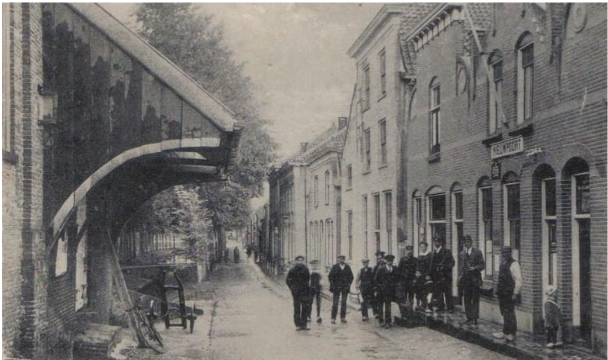
20: Hoe heet de straat tegenover de binnenhaven?