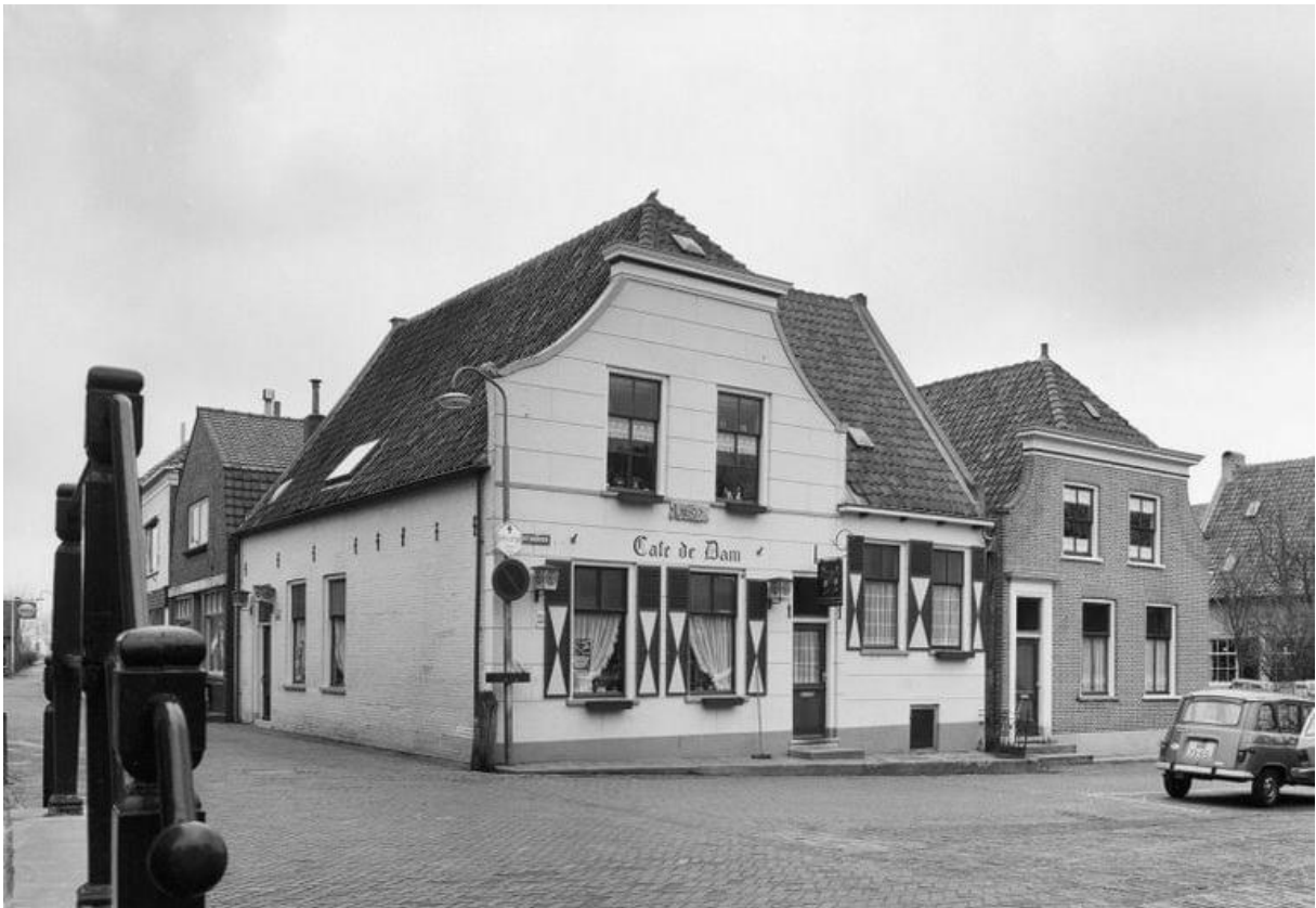
18: Hoe heet het standbeeld wat op de dam staat?