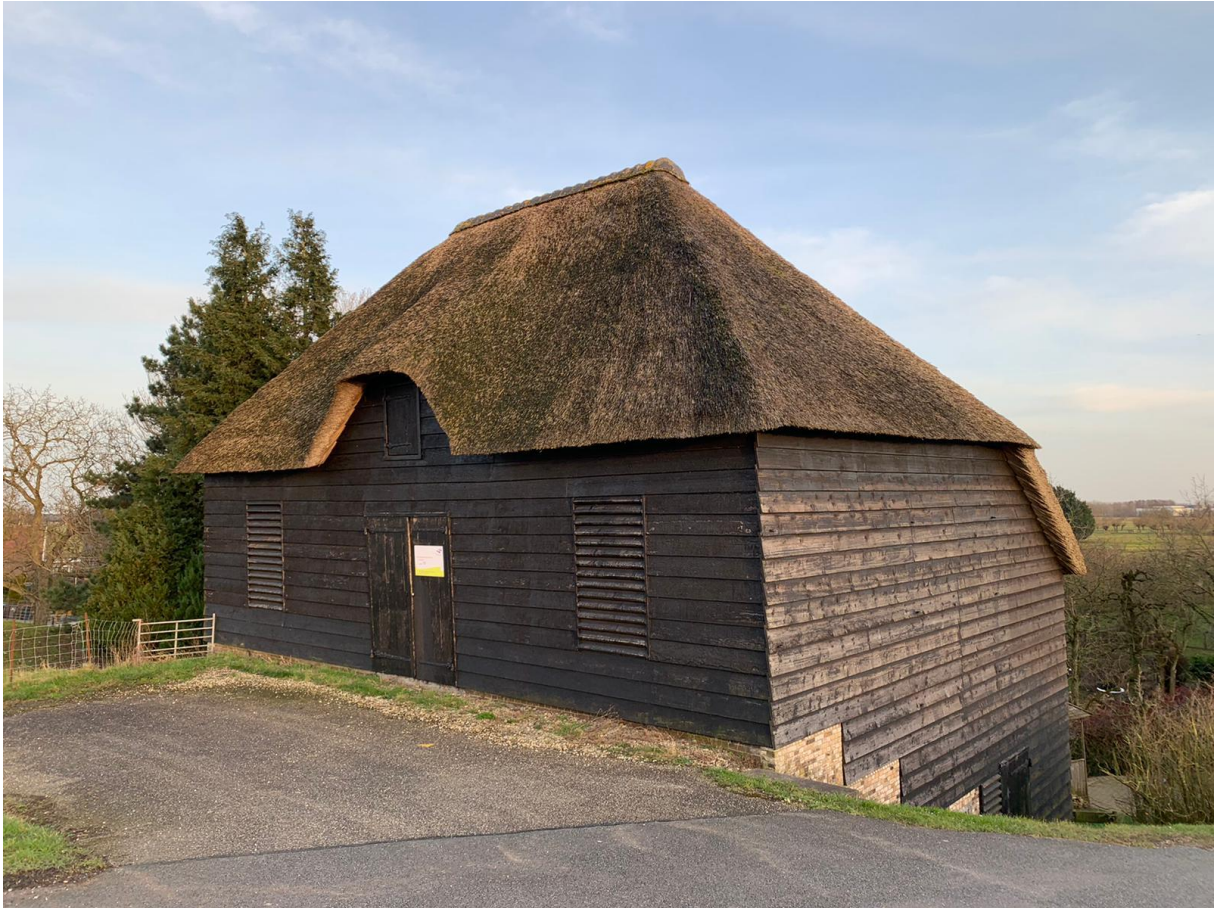
11: Waar is het dak van deze schuur van gemaakt?