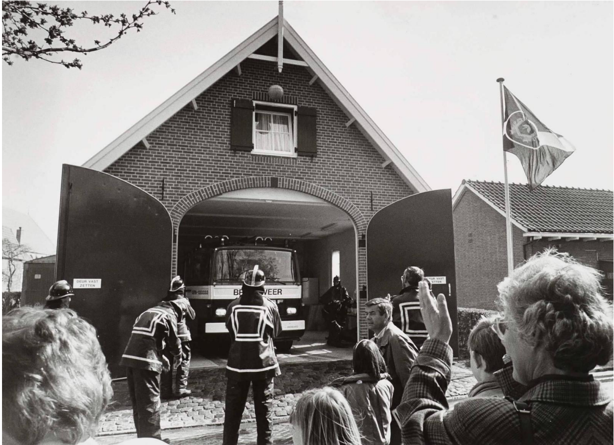
19: Hoe hoog zijn deze deuren?