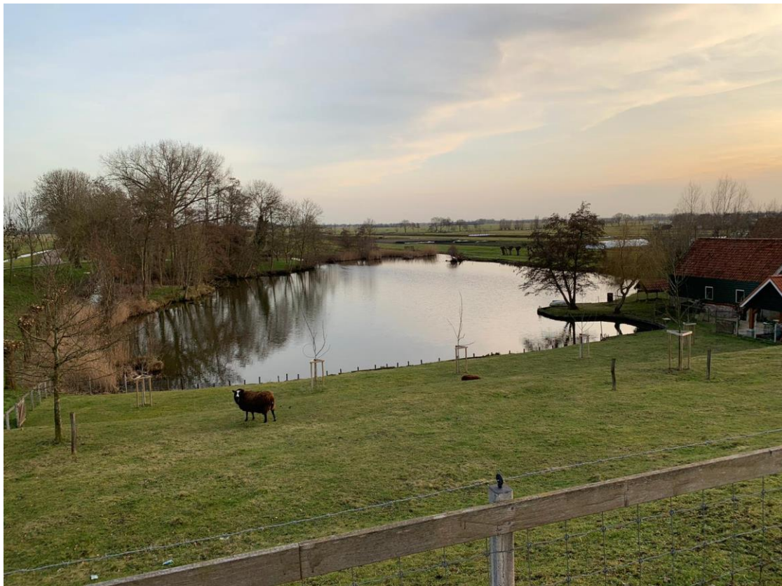
12: Is het water zoet of zout?