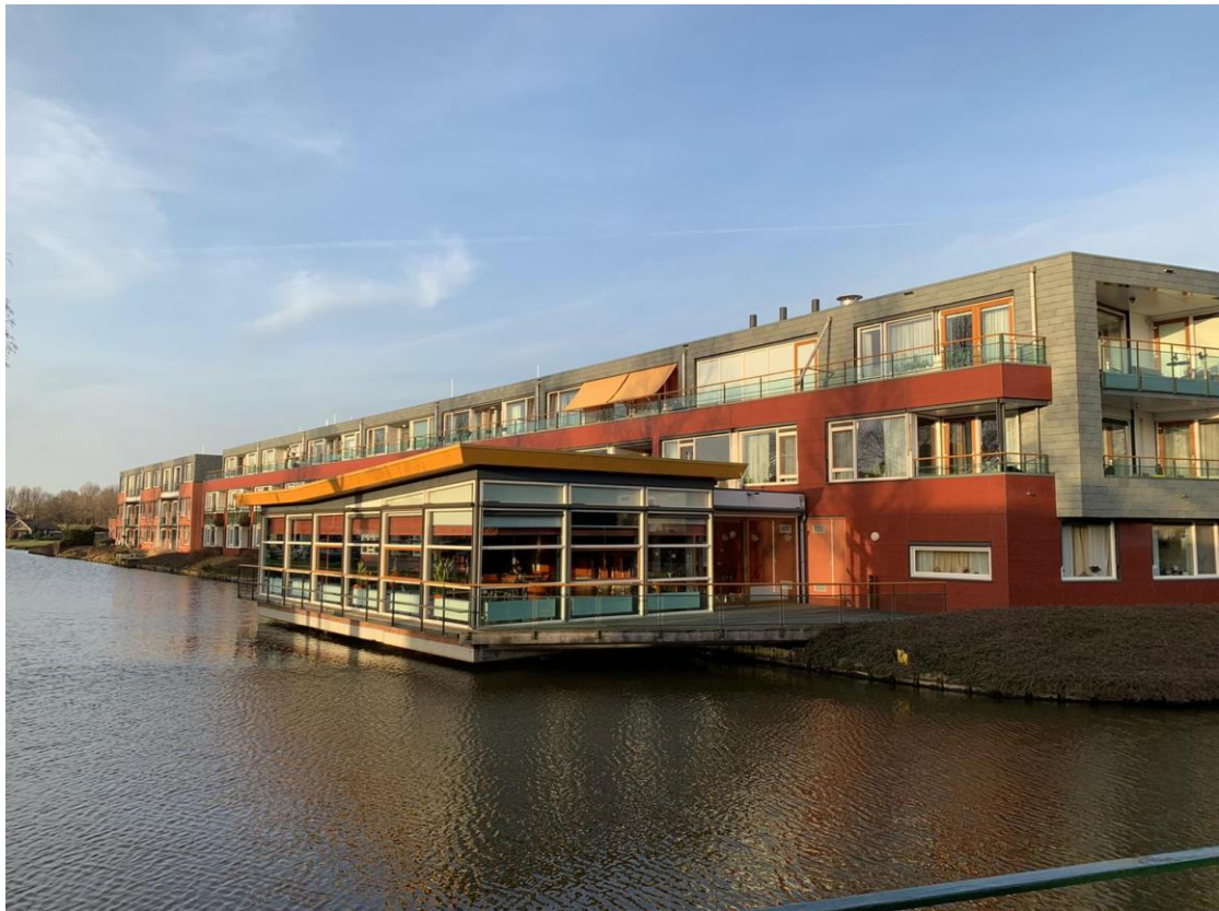
5: Hoeveel brievenbussen heeft dit gebouw?