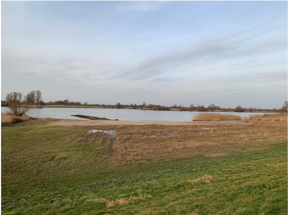
13: Hoe heet het water waar Langerak en Nieuwpoort langs liggen?