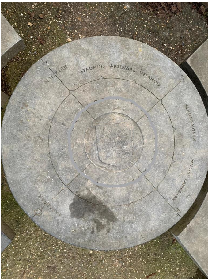
16: Ligt Langerak aan de noord, oost, zuid of west kant van Nieuwpoort?