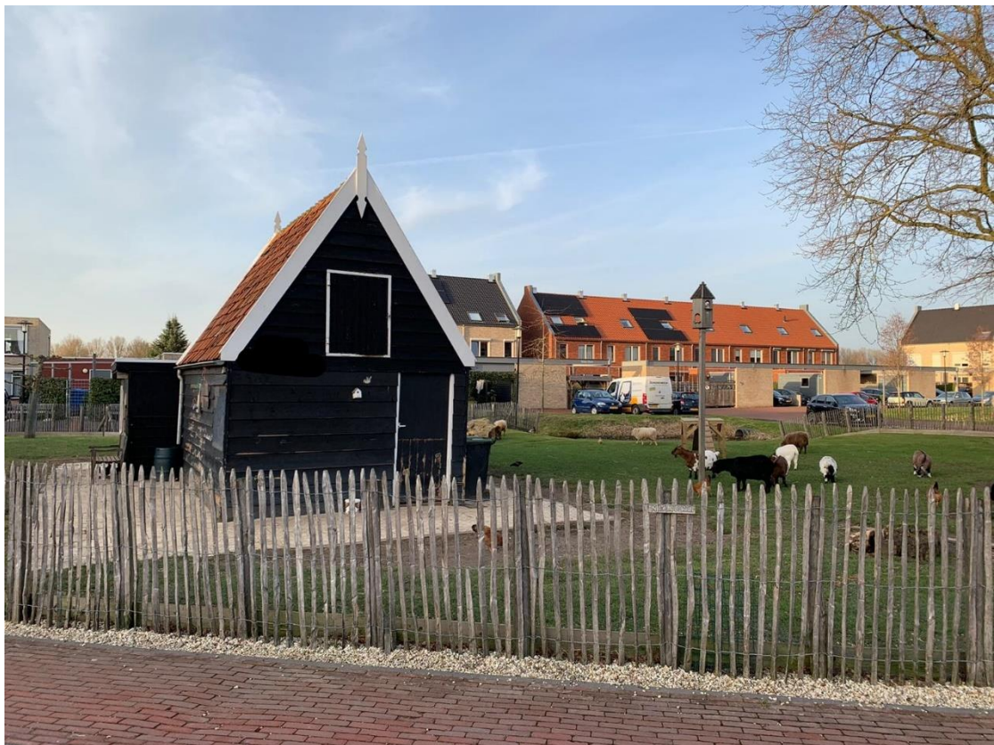
10: Hoe heet dit schuurtje?