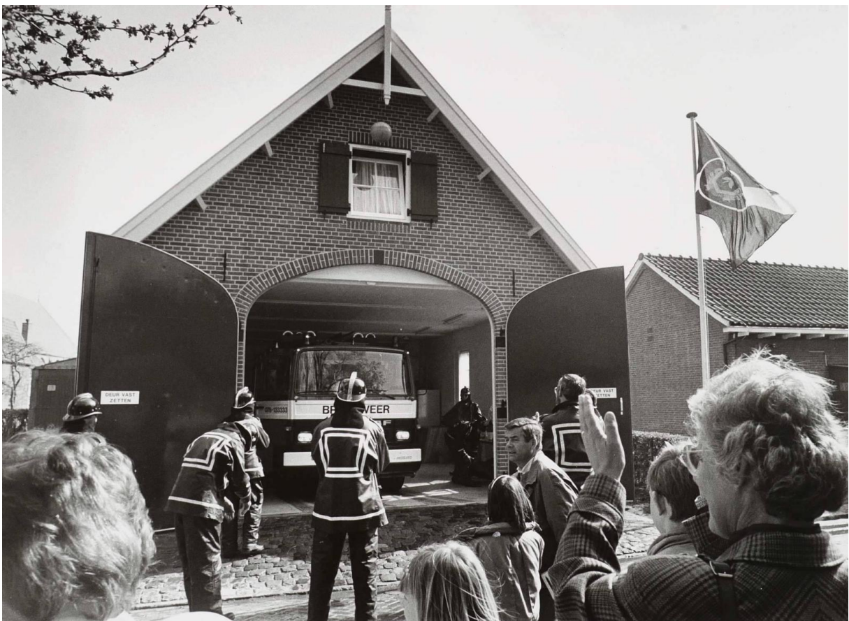
30: Hoe heet de straat waar de brandweer op deze foto gevestigd zat?