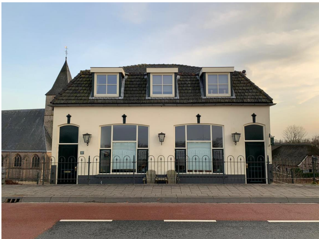
22: Wat was de naam van de kroeg die hier vroeger stond?