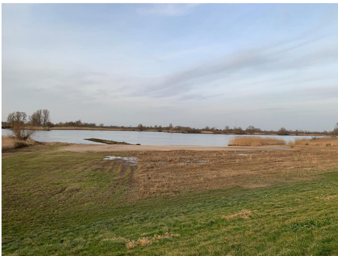
20: Hoe heet dit strand?