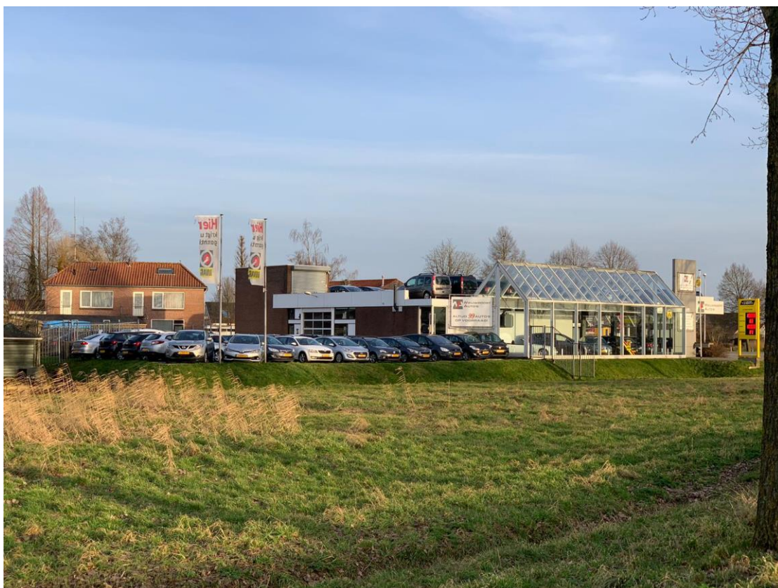
8: Welk bedrijf ziet u hier?