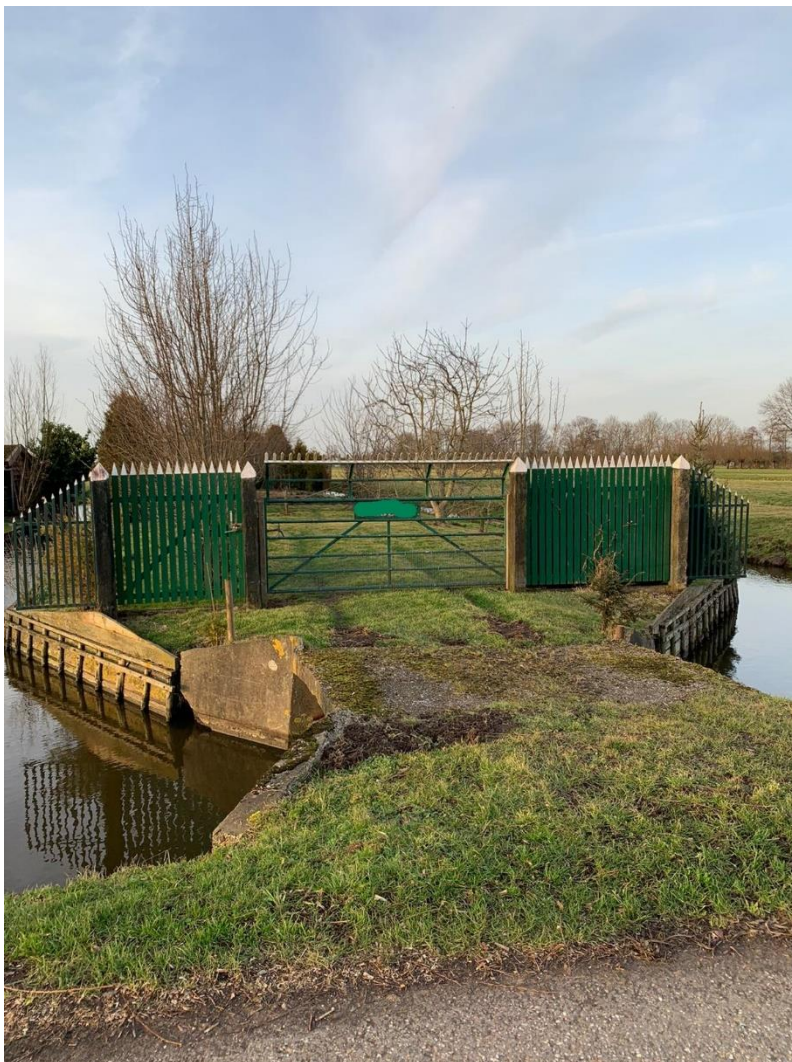
14: Wat staat er op dit hek?