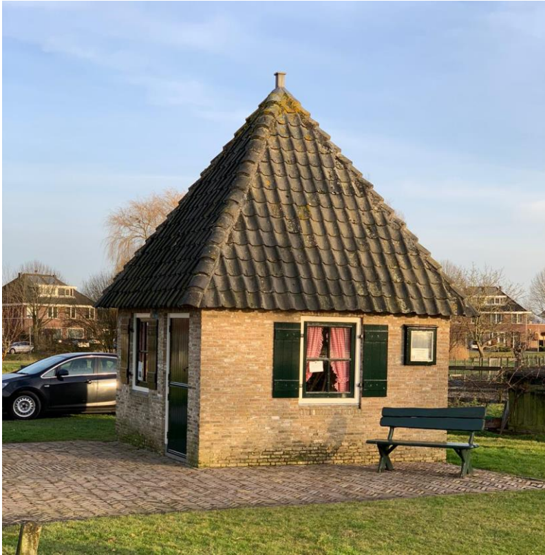
11: Waar staat dit huisje?