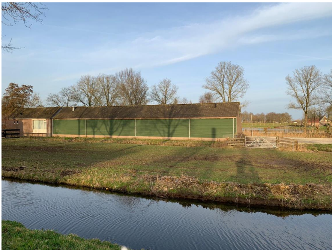
7: Welke vereniging zit in dit gebouw?