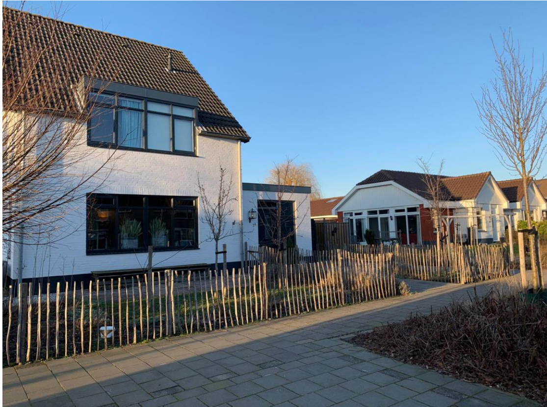
23: Hoe heet de school die hier vroeger stond?