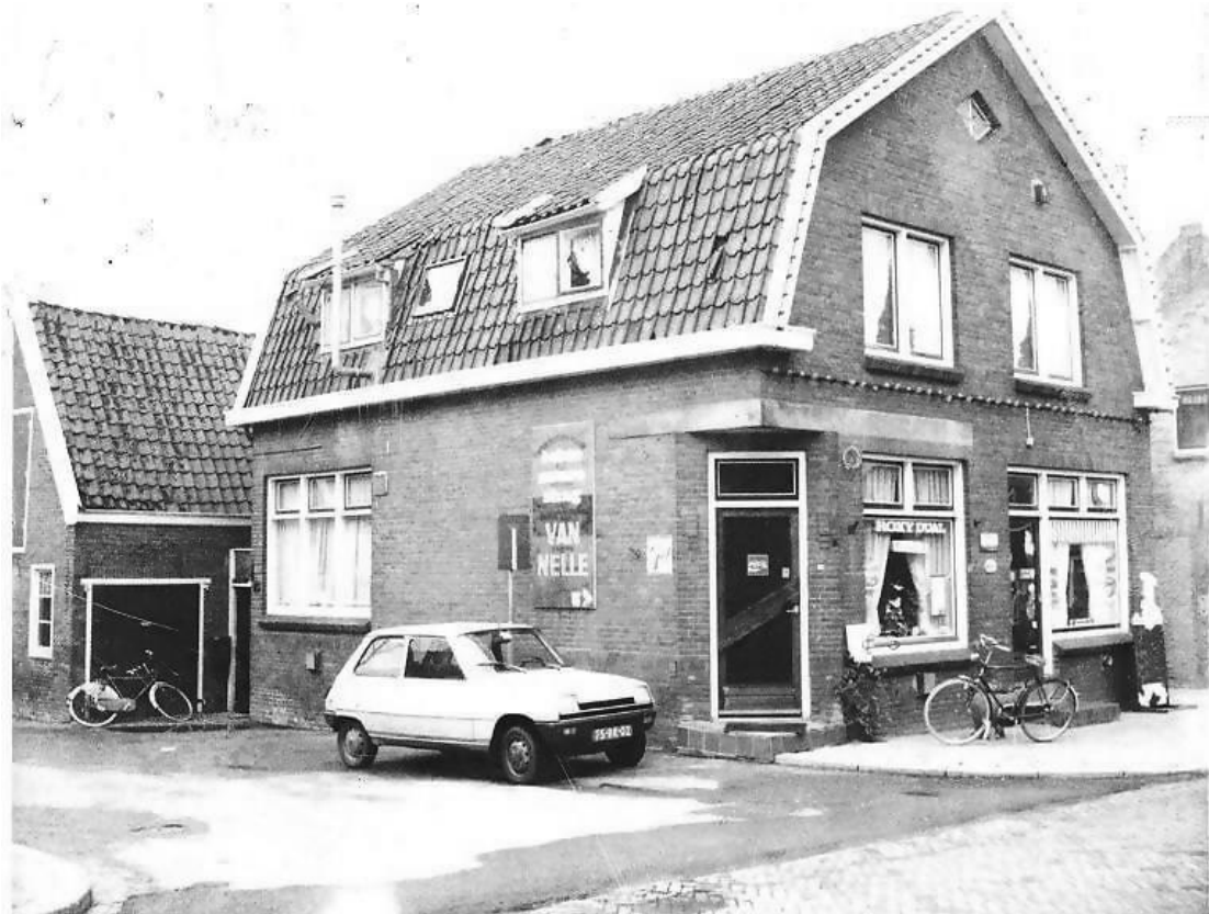
26: Hoe heet deze kroeg?