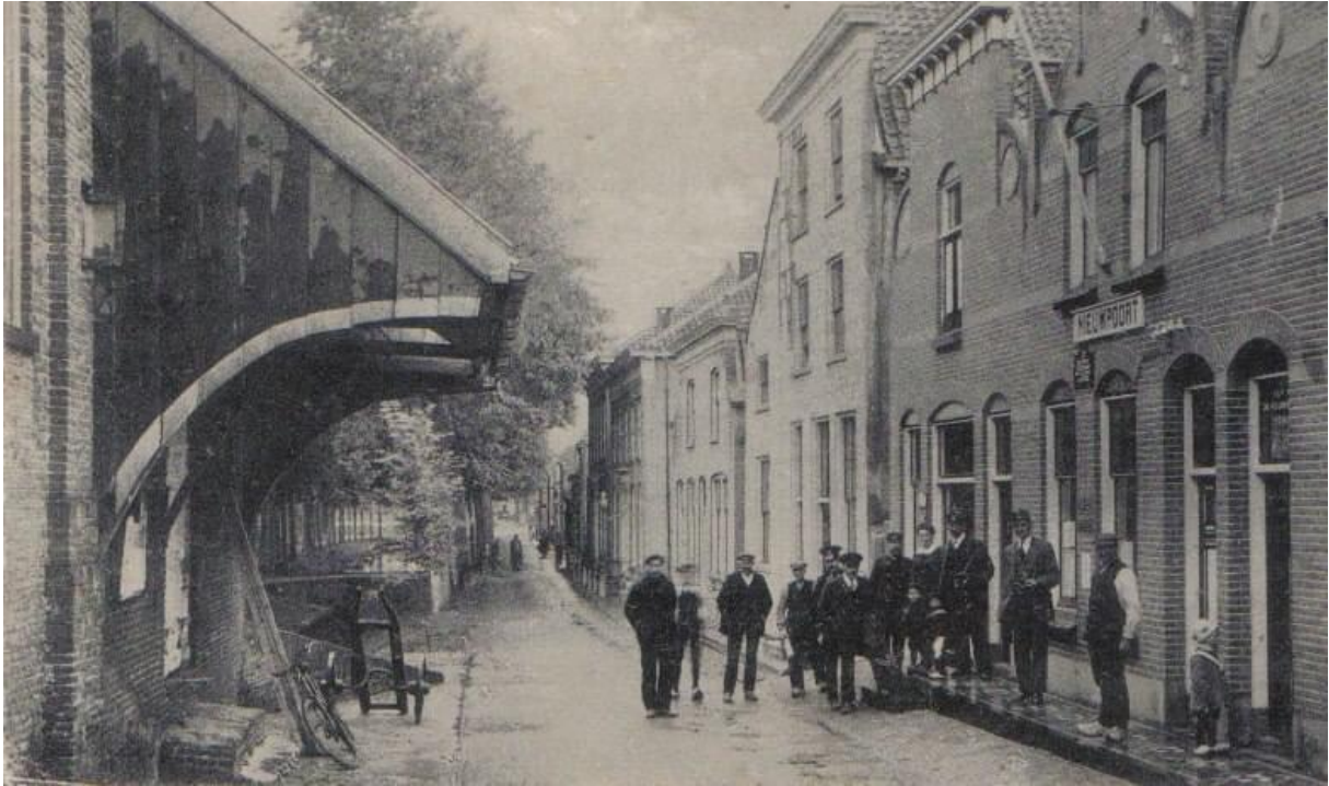
33: Hoe heet deze straat?