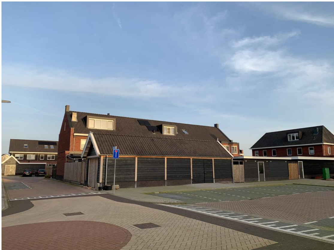
12: Hoe heet de school die hier vroeger stond?