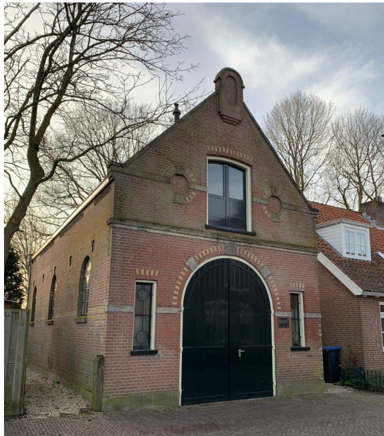
4: Hoe heet dit gebouw?