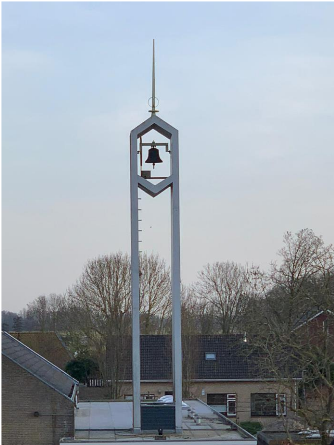
18: Hoe heet het gebouw waar deze bel bij hoort?