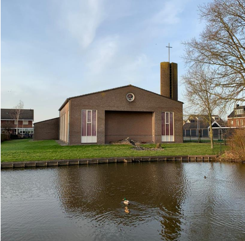
13: Hoe heet deze kerk?