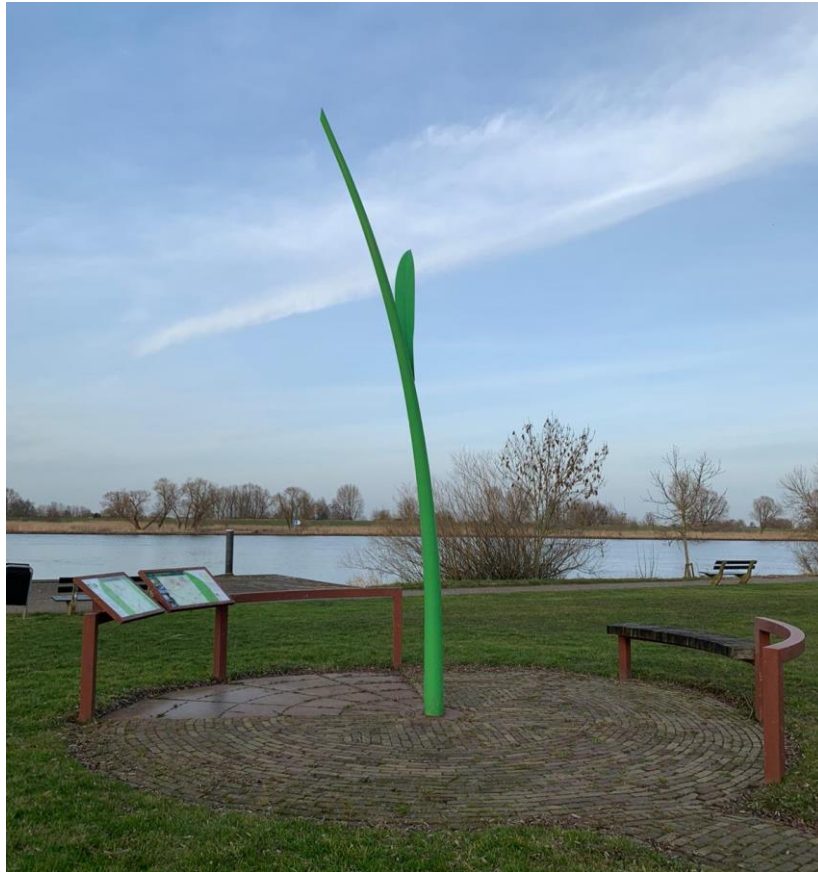
3: Wat is dit voor punt?