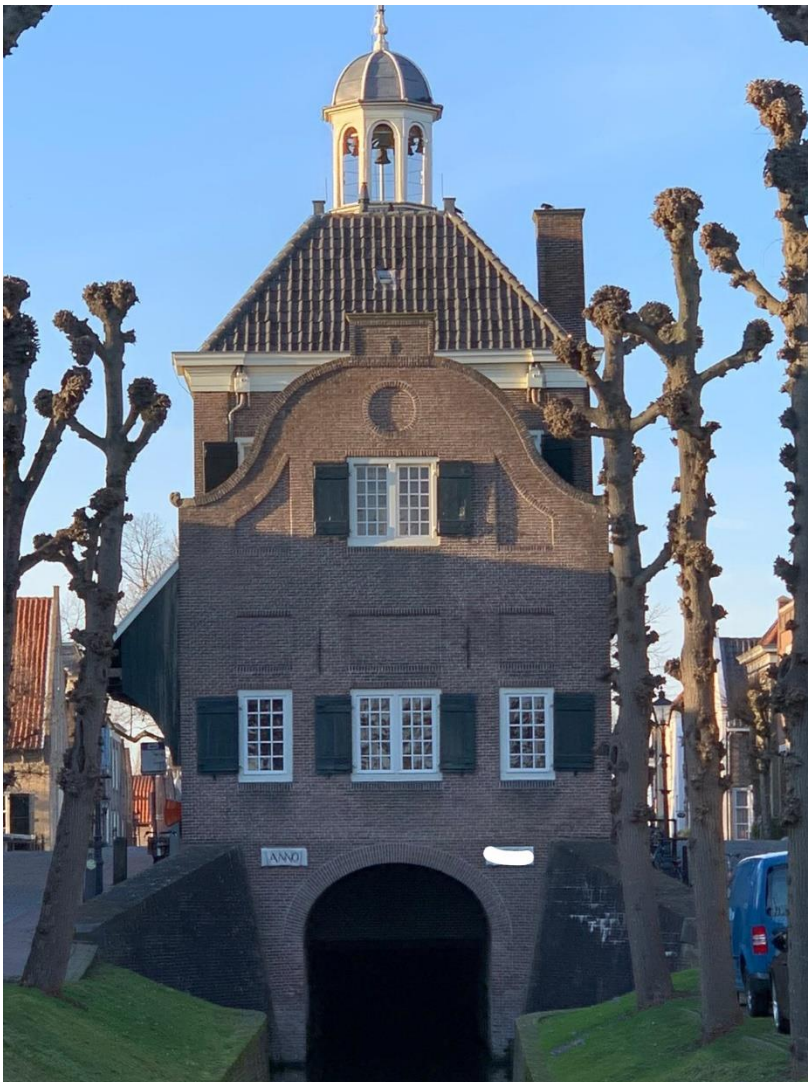
34: Welk jaartal staat op de achterkant van het stadhuis?