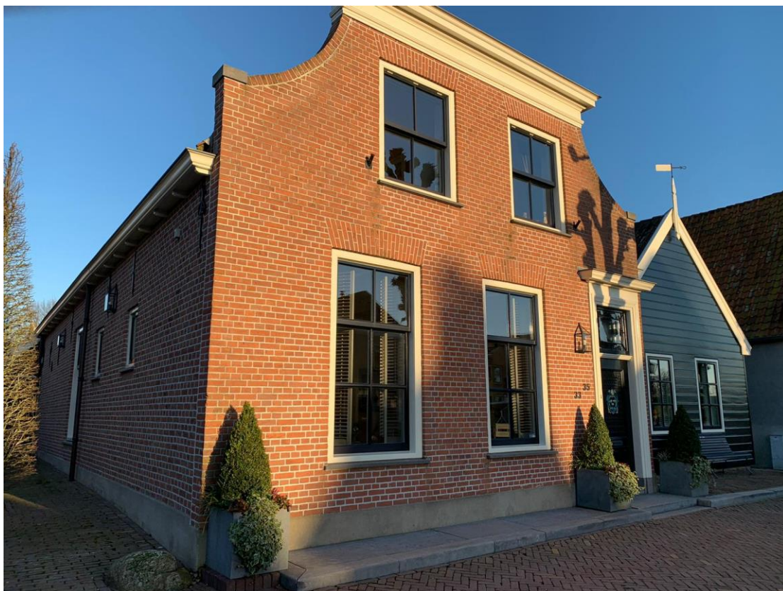
31: Wat was dit gebouw vroeger?