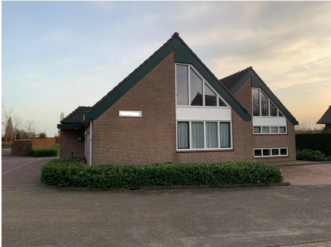
21: Wat is de naam van dit gebouw?