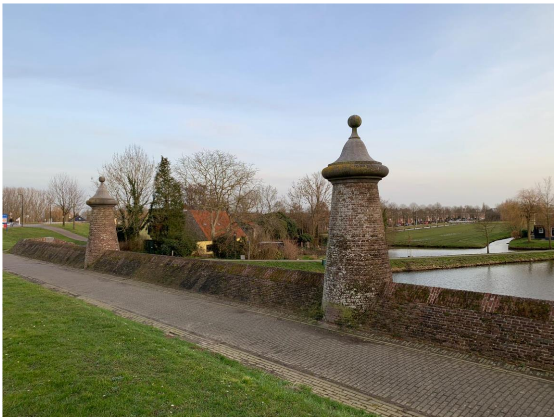
24: Uit welke drie onderdelen bestaat de beer met twee monniken?